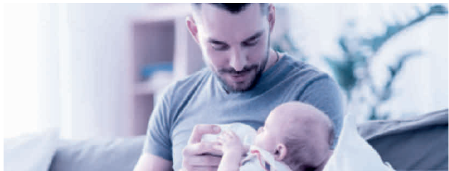
Vaterschaftsurlaub: innert sechs Monaten nach der Geburt zu beziehen.

Das Unternehmen muss dem Vater zehn arbeitsfreie Tage gewähren und hat für diese Zeit Anspruch auf 14 Taggelder. Es ist Sache des Arbeitgebers, bei der Ausgleichskasse – welche auch die EO-Beiträge abrechnet – den Antrag auf die Vaterschaftsentschädigung zu stellen. Der Antrag sollte aber erst gestellt werden, wenn der Arbeitnehmer den ganzen Vaterschaftsurlaub bezogen hat und der Arbeitgeber dies mit dem Antrag bestätigen kann. Die Auszahlung der Vaterschaftsentschädigung erfolgt dann nachgelagert