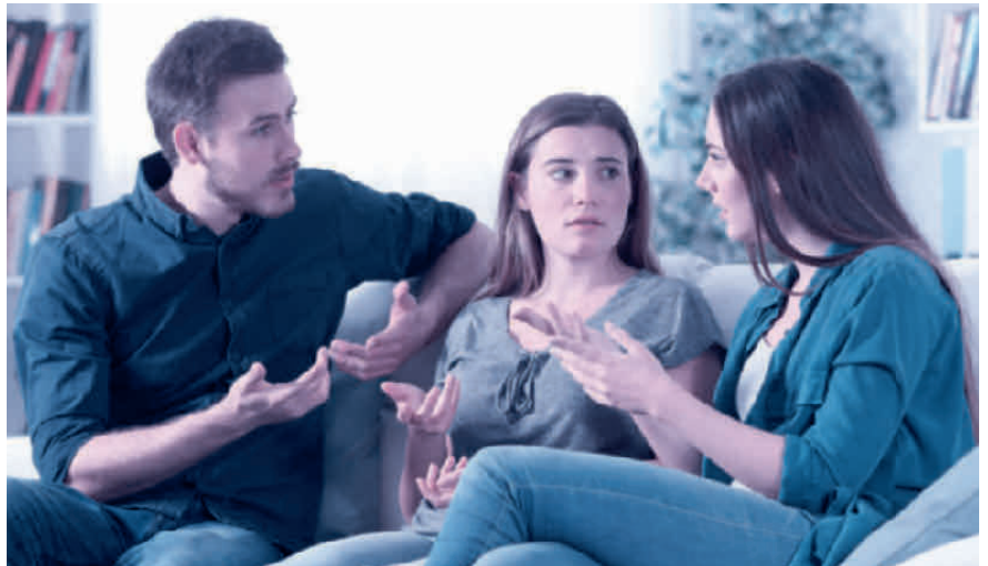
Kommt es zum Streit zwischen den Erben, muss der Willensvollstrecker schlichten.

Der Willensvollstrecker setzt den letzten Willen des Erblassers um. Dafür stellt er als Erstes ein Inventar auf, das er laufend nachführt. Er verwaltet die Erbschaft bis zur Teilung und muss darauf achten, dass das Vermögen erhalten bleibt. Er bezahlt die Schulden des Erblassers inklusive der Todesfallkosten und treibt offene Forderungen ein. Zur Verwaltung gehören auch die laufenden Geschäfte, beispielsweise muss er sich um den Unterhalt von Liegenschaften kümmern, laufende Verträge kündigen oder allenfalls die Liquidation einer Einzelunternehmung umsetzen. Er ist verantwortlich für die Erstellung der